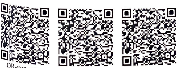
QR-код содержит хэш-сумму электронного документа в PDF формате, подписанного ЭЦП

ИС «Единый реестр досудебных расследований»